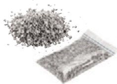
Spezialgranulat 0,50 kg Art.-Nr. 21823