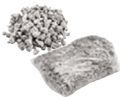
Spezialgranulat 1,50 kg Art.-Nr. 21824