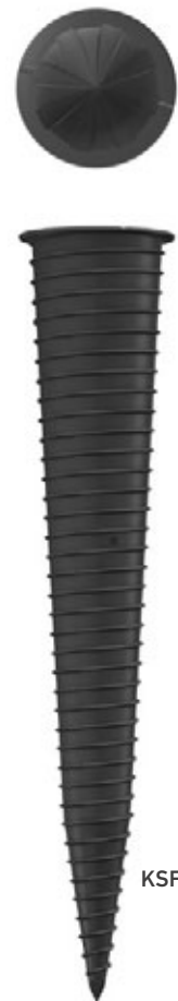
KSF K 60x800